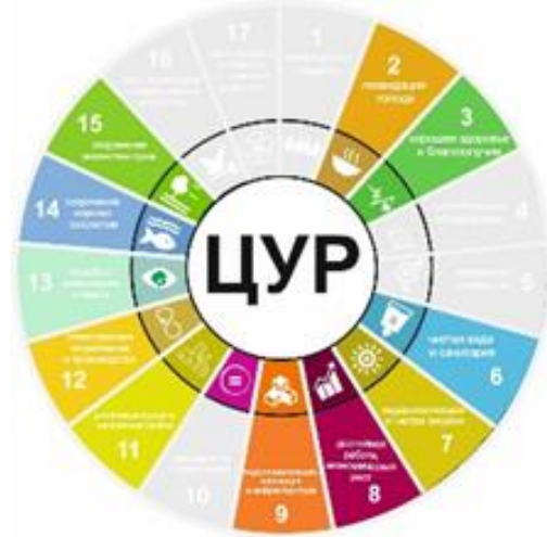
Рисунок 2 – Вклад акселератора 1 в достижение ЦУР

Реализация мероприятий регионального акселератора «Экологизация регионального развития» внесет вклад в достижение следующих ЦУР: 2, 3, 6, 7, 8, 9, 11, 12, 13, 14 (рисунок 2).