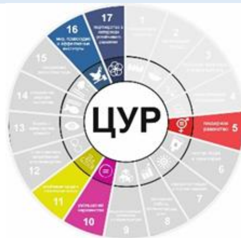
Рисунок 5 – Вклад акселератора 4 в достижение ЦУР

Реализация мероприятий регионального акселератора «Вовлеченное управление региональным развитием» соответствует рекомендациям миссии MAPS для достижения целей ЦУР в Республике Беларусь и внесет вклад в достижение всех 17 ЦУР, в наибольшей степени 5, 10, 11, 16, 17 (рис. 5).